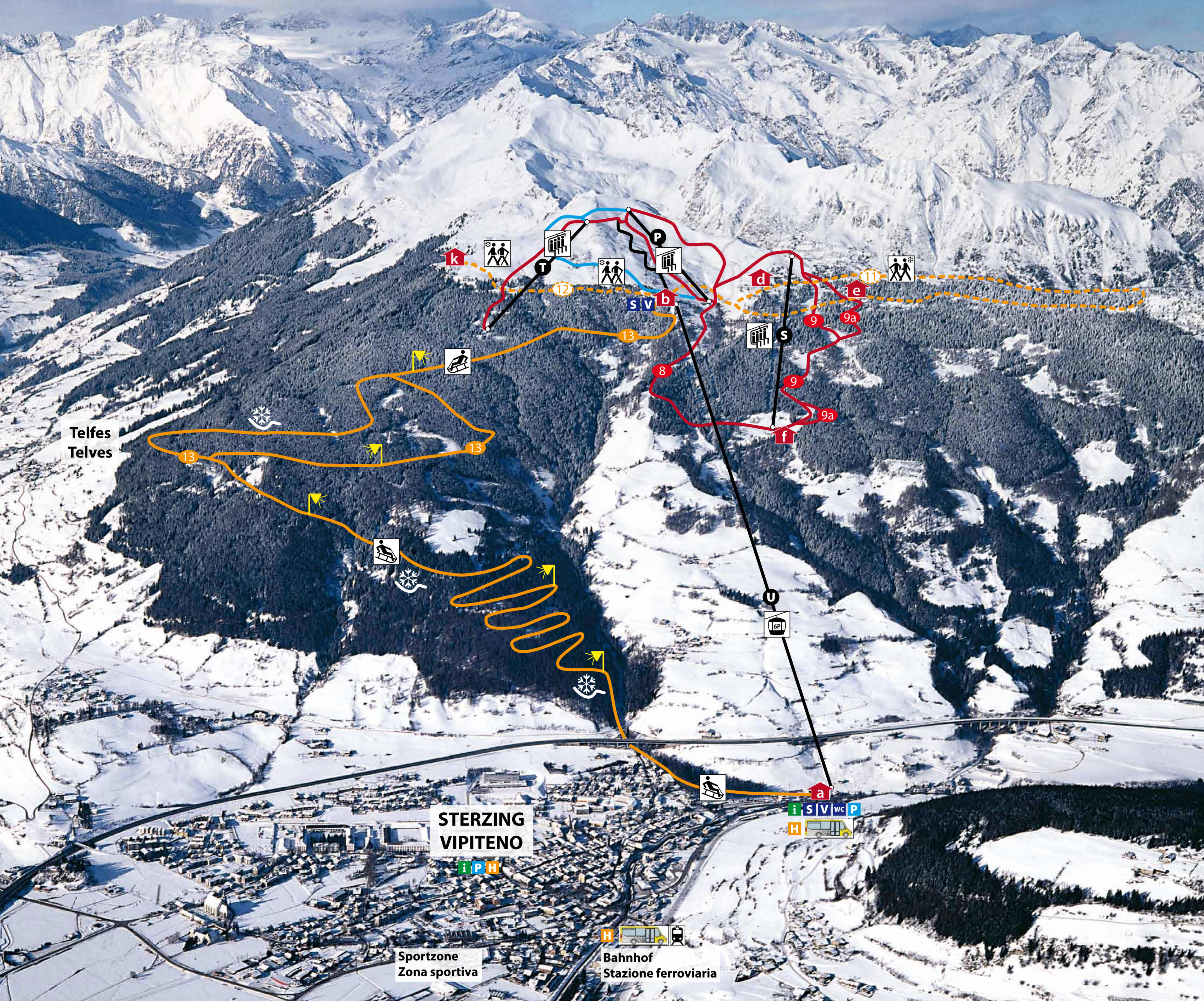
Foto: Tappeiner, Lana – Überleger: graphic Kraus, Sterzing / Vipiteno